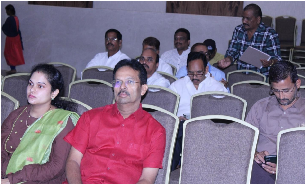
Rotarians & Anns, who attended the function