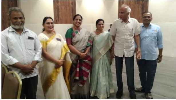
Rotarians and their family members attended the function