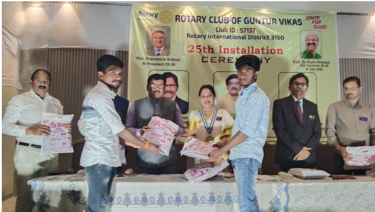
Distribution of New Clothes & Note Books to inmates of HEAL Children Village, Chowdavaram, through the hands of Sri P. Srinivasulu, IAS, Municipal Commissioner, Guntur Municipal Corporation