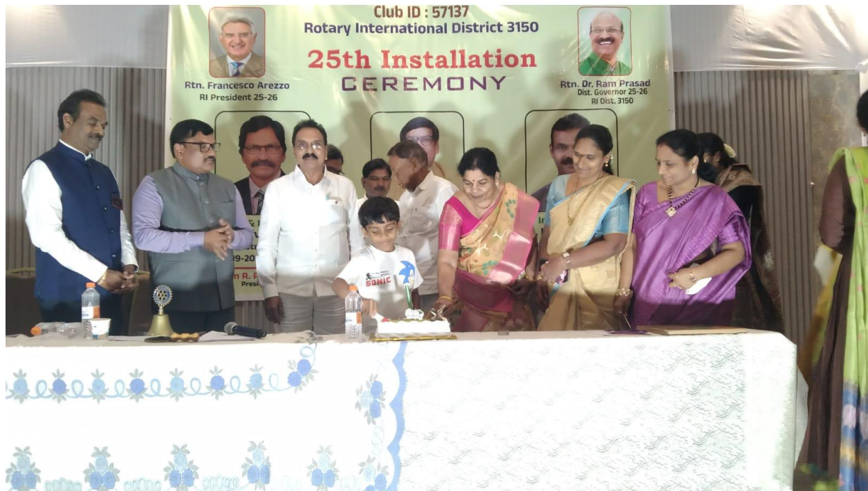
Birthdays of Rotarians & Family Members, in the month of July, 2025 were celebrated, by cutting cake and wishful greetings.