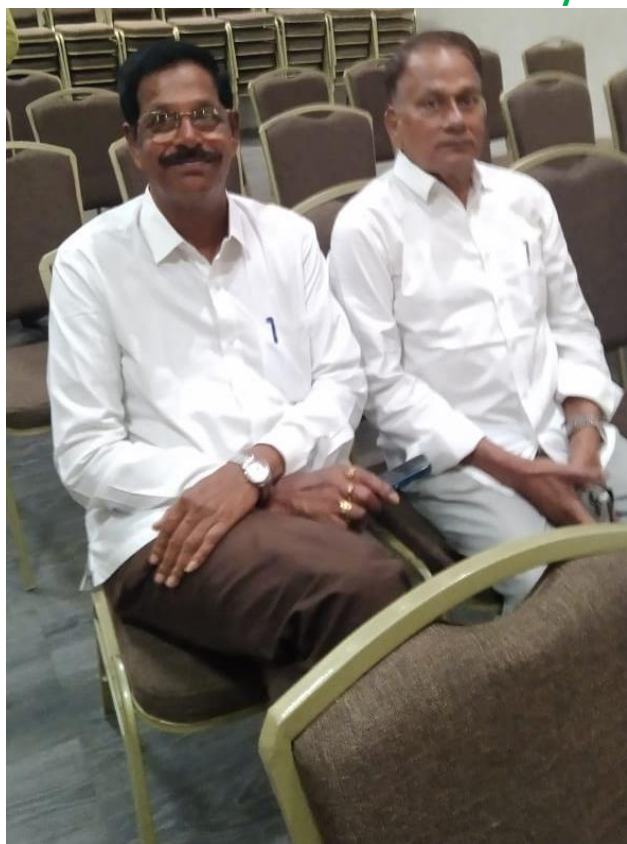
Rotarians and their family members attended the function