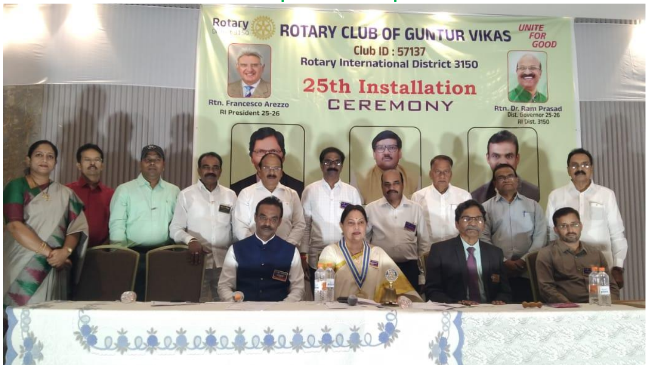
Board Members group photo