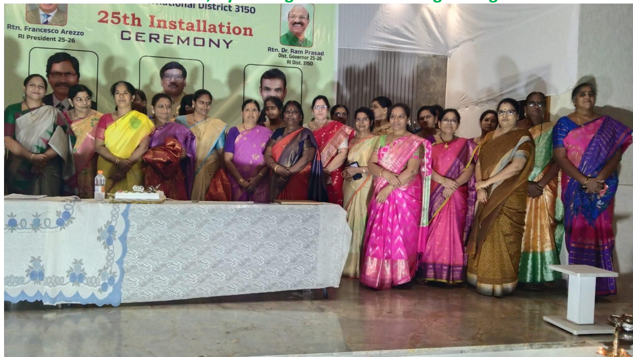
Anns group photo